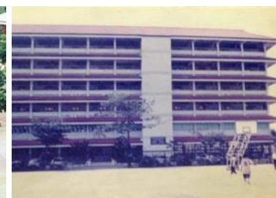
ภาพการก่อสร้างอาคารเรียนที่สองและสามของโรงเรียน

วันที่ 2 กรกฎาคม 2534 กระทรวงศึกษาธิการ ได้ออกประกาศกระทรวงศึกษาธิการให้เปลี่ยนชื่อโรงเรียนบางเขนวิทยาเป็น โรงเรียนราชวินิตบางเขนและได้รับ พระราชทานพระบรมราชานุญาตจากพระบาทสมเด็จพระเจ้าอยู่หัวภูมิพลอดุลยเดช ให้ัญเชิญพระมหาพิชัยมงกุฎ เป็นตราสัญลักษณ์ของโรงเรียน