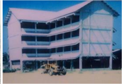
ภาพการก่อสร้างอาคารเรียนแรกของโรงเรียน

วันที่ 1 พฤศจิกายน 2531 โรงเรียนบางเขนวิทยาได้รับพระราชทานพระบรมราชานุญาต จากพระบาทสมเด็จพระเจ้าอยู่หัวภูมิพลอดุลยเดช ให้ใช้ชื่อโรงเรียนว่า โรงเรียนราชวินิตบางเขน เพื่อเป็นไปตามพระราชดำริ ในการจัดตั้งโรงเรียน