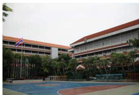
ภาพตราสัญลักษณ์ของโรงเรียน และบรรยากาศของโรงเรียน

วันที่ 25 พฤศจิกายน 2540 ผ่านเกณฑ์การประเมินและได้รับการประกาศให้เป็นโรงเรียนมัธยมศึกษาดีเด่น ของกระทรวงศึกษาธิการ ประจำปีการศึกษา 2540 ในวันที่ 30 มกราคม 2541