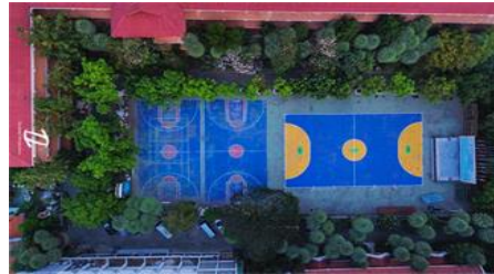
อาคาร 3 อาคารเฉลิมพระเกียรติ 48 พรรษา