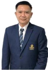
นายฤชดา สิมะเป็